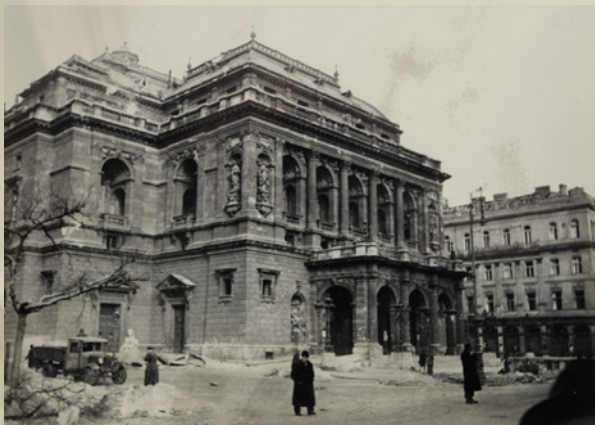
AZ OPERAHÁZ ÉPÜLETE 1945-BEN