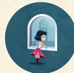
Radina Dace / Léo Delibes KISCOPPÉLIA (ősbemutató)