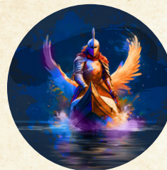
Richard Wagner LOHENGRIN