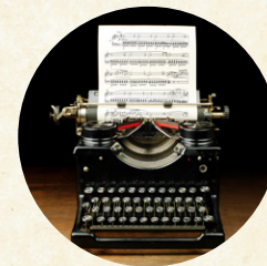
Selmeczi György KIRÁLYI FENSÉG (ősbemutató)