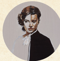
Ludwig van Beethoven FIDELIO