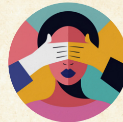
Wolfgang Amadeus Mozart COSÌ FAN TUTTE